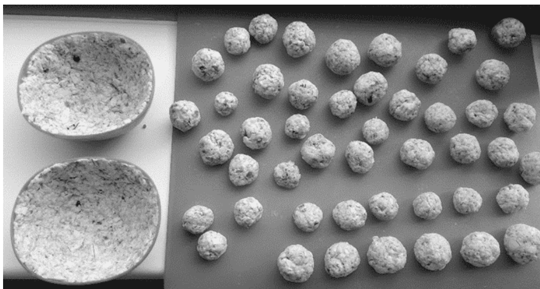
Obr. 5 Příprava ptačího hnízda a vajíček (technika papier machê)

V projektu "Očekávání jara" tato technika posloužila k vytvoření ptačího hnízda a vajíček. Obr. 5 a 6.