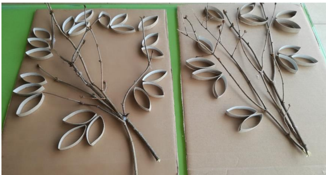
Obr. 3 a 4 Část projektu Očekávání jara (asambláž)

Přírodní materiál – drobné větvičky stromů – byl doplněn "listy" vytvořenými nastříháním zmáčkuté papírové roličky z vnitřku toaletního papíru. Listy stříhaly klientky pouze nahodile, nikoli podle šablony. Právě rozmanitost různě vysokých listů působila při jejich nalepení na pevnou podložku přirozeně a zajímavě.