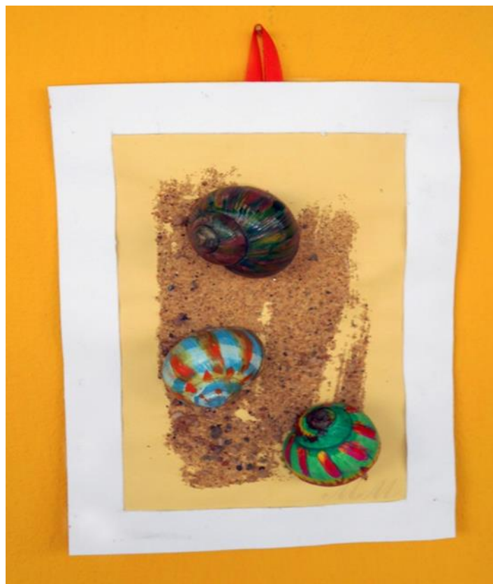
Obr. 11 Asabláž ze šnečích ulit a písku