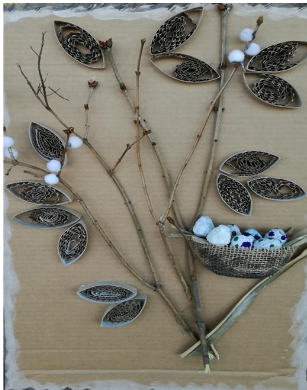
Obr. 6. Část projektu Očekávání jara (kombinace technik)