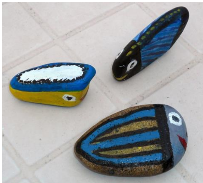
Obr. 9 Malba na oblázky