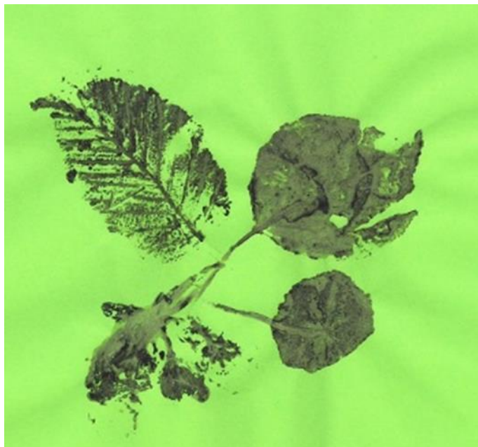
Obr. 1 Listy (otisk)