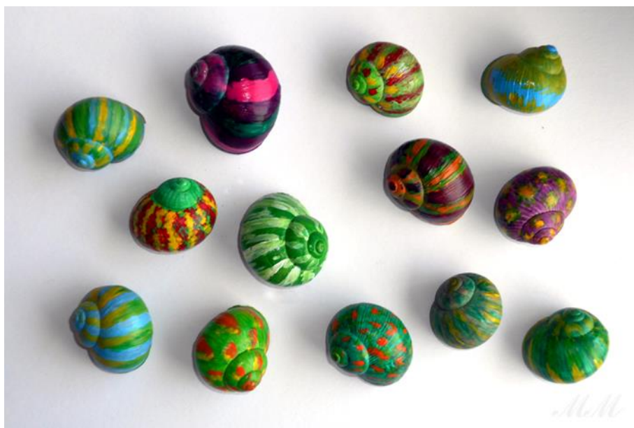
Obr. 10 Malba na šnečí ulity