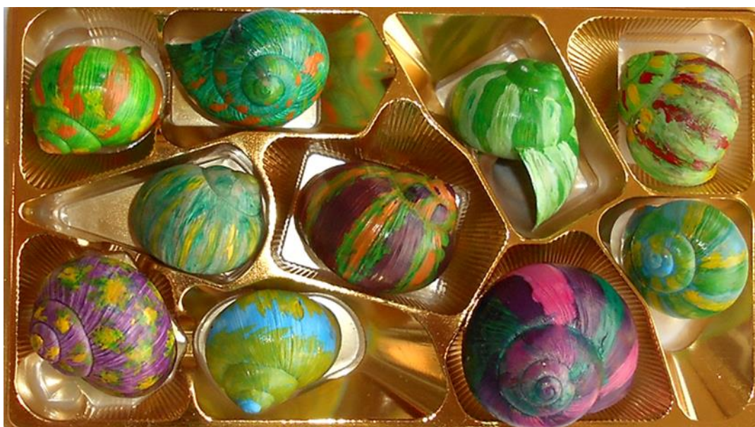
Obr. 12 Šnečí bonboniéra